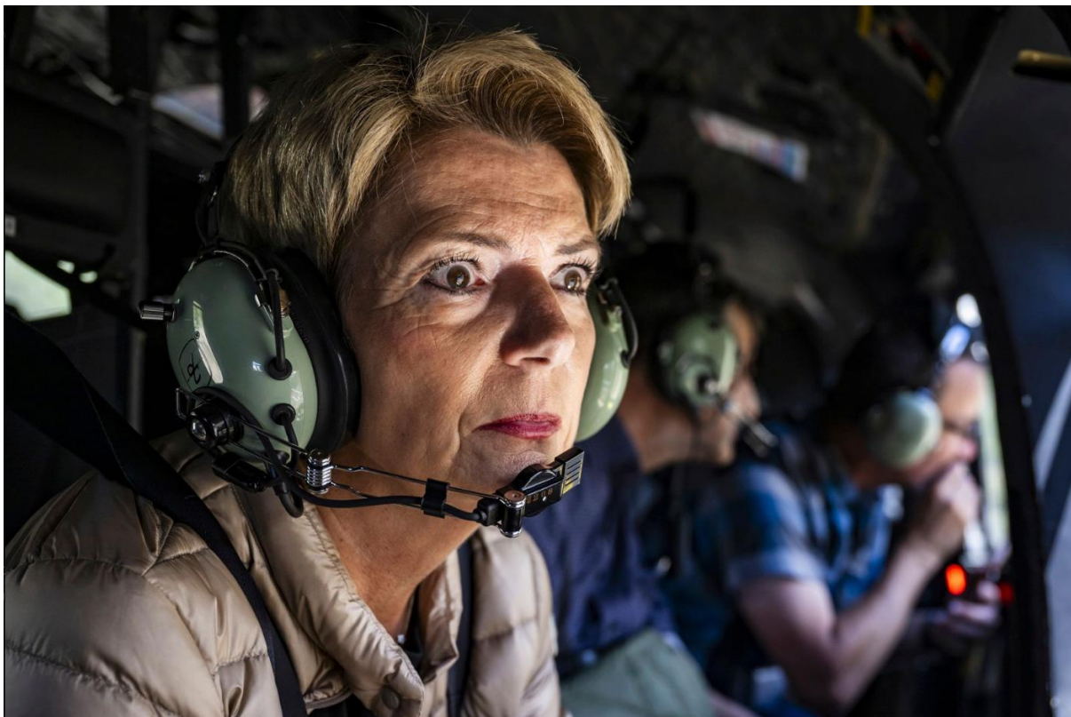
Švýcarská prezidentka Karin Kellerová-Sutterová z paluby vrtulníku monitoruje škody způsobené katastrofickým sesuvem, který zcela zničil vesnici Blatten.