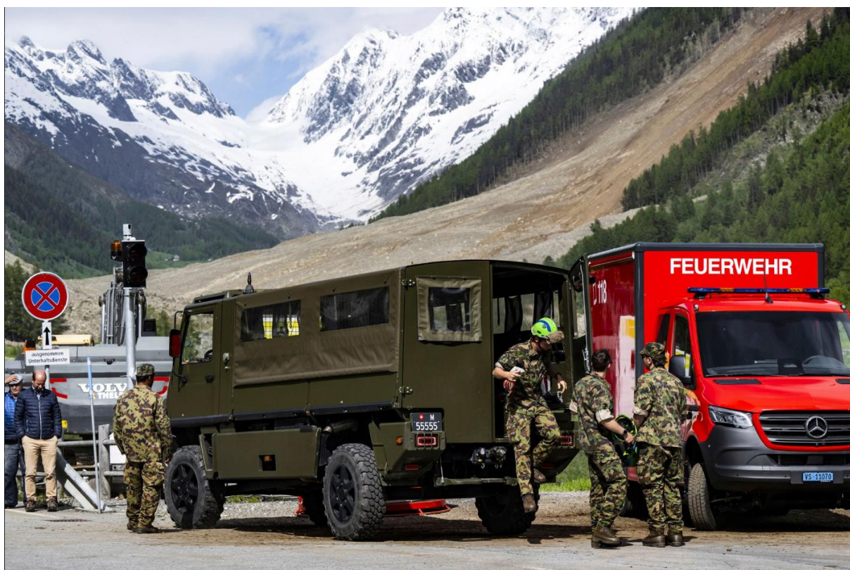
Armáda je připravená zasáhnout s pomocí čerpadel, bagrů a další těžké techniky, aby pomohla ulevit tlaku na řece Lonza, která je přítokem Rhôny. Čeká, až to podmínky v oblasti dovolí.